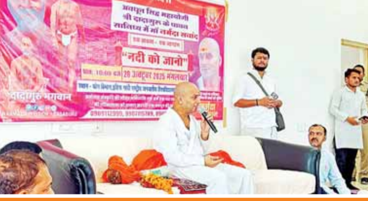
मां नर्मदा की गुरुजी ने उतारी आरती, सबके मंगल की कामना