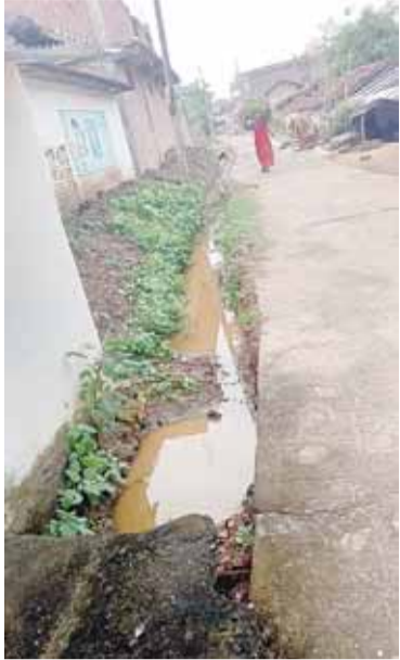
शिकायत करता है तो उसे झूठे मामले में फंसा दिया जाता है इसी तरह से ग्राम पंचायत कभी नहीं खुलती और ग्राम पंचायत की जो शिकायत