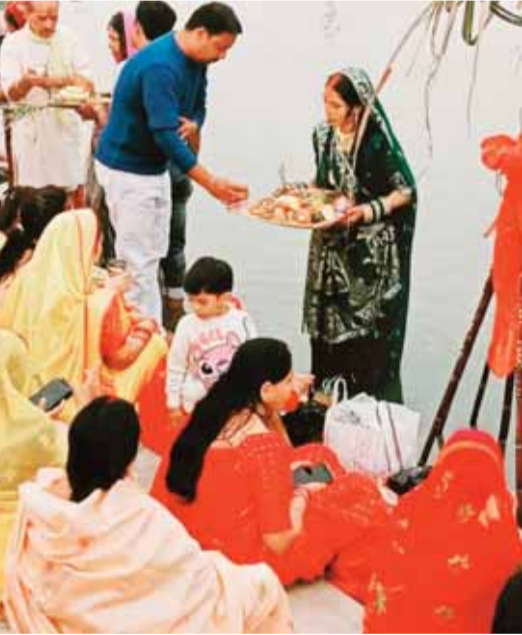
नहाय-खाय के साथ आरंभ हुआ था। इसके बाद पूरी पवित्रता के साथ अरवा चावल, चना दाल, कद्दू की सब्जी और आंवले की चटनी आदि का भोग लगाकर प्रसाद तैयार किया। रविवार को खरना पूजन के

छठ महापर्व के आखिरी दिन सूर्योदय के दौरान अर्घ्य देते समय मंत्र-ओम एहि सूर्य सहस्त्रांशो तेजोराशे जगत्पते, अनुकंपय माम भक्त्या गुहाणार्घ्यं दिवाकर का जाप किया गया। महापर्व छठ का चार दिवसीय अनुष्ठान शनिवार को